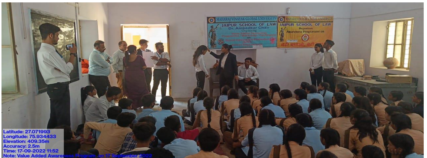
Latitude: 27.071993 Longitude: 75.934433 Elevation: 409.35m Accuracy: 2.5m Time: 17-09-2022 11:52 Note: Value Added Awareness Program on 17 September 2022