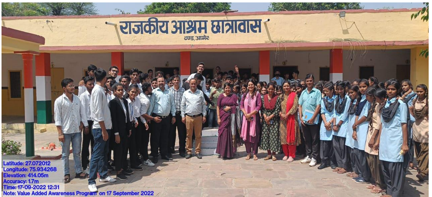
Latitude: 27.072012 Longitude: 75.934268 Elevation: 414.05m Accuracy: 1.7m Time: 17-09-2022 12:31 Note: Value Added Awareness Program on 17 September 2022